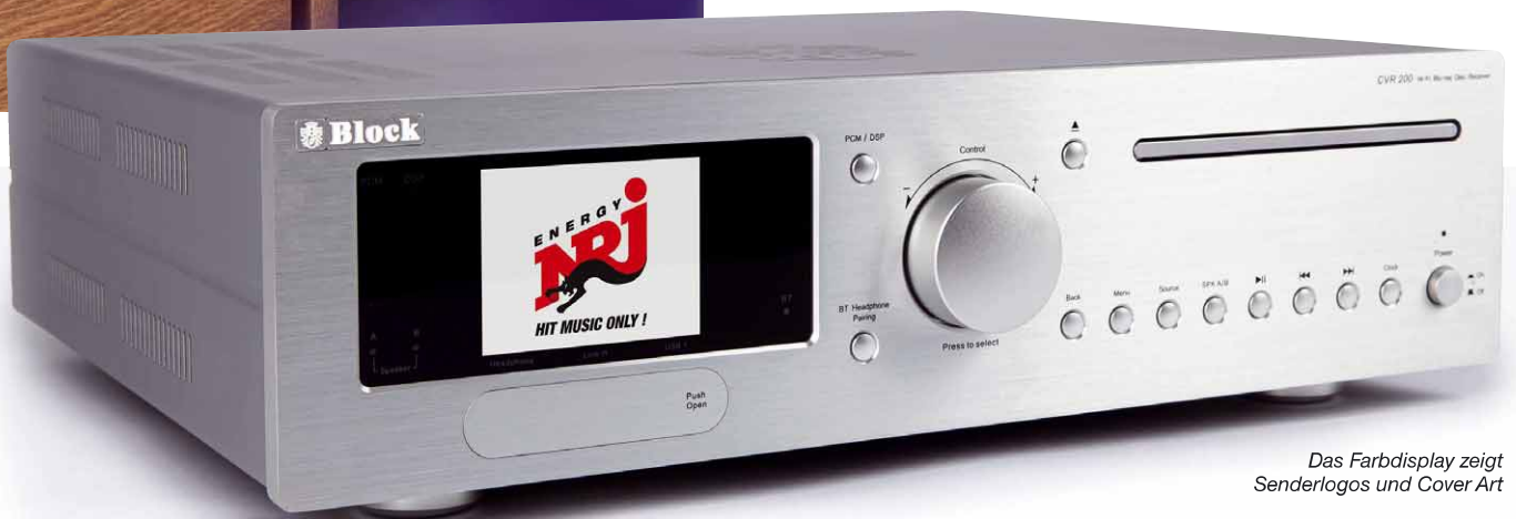
Das Farbdisplay zeigt Senderlogos und Cover Art

Und überhaupt beeindruckt das Multitalent mit seinem Funktionsumfang. Kurz gesagt: Zwei amtliche Lautsprecher anschließen und die hochwertige HiFi-Kette ist fertig! Etwas länger ausgedrückt beherbergt der CVR-200 neben der Verstärker-Sektion auch UKW- und Digitalra-