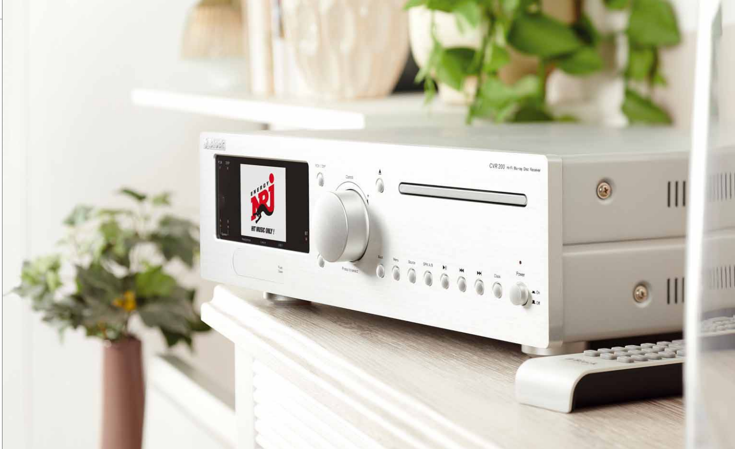
Das Laufwerk spielt neben CDs auch DVDs und Blu-ray-Discs ab

sikwiedergabe beherrscht er die feinen Nuancen im Mittel- und Hochtonbereich. Ebenso vermag er bei dynamischen Soundtracks von Filmen beherzt auszuteilen und dem Filmgeschehen akustisch Nachdruck zu verleihen. So ist er nicht nur durch seine umfangreichen Funktionen vielfältig einsetzbar, er versteht sich auch klanglich auf alle Musik- und Filmgenres. Dabei ist er in keiner Weise zickig, auch die Einbindung ins Netzwerk ist problemlos in kürzester Zeit erledigt.