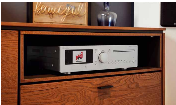
In den Farben Diamantsilber und Saphirschwarz ist der CVR-200 für 1.700 Euro erhältlich, die Chromvarianten kosten 300 Euro Aufpreis