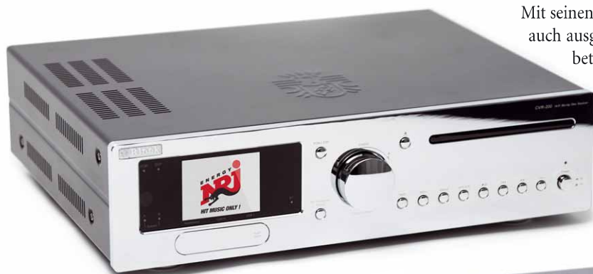
Limitierte Hochglanz-Sondereditionen in Chrom-Silber und Chrom-Schwarz

Mit seinen guten 60 Watt pro Kanal ist der Block muskulös genug, um auch ausgewachsene Standlautsprecher souverän und kontrolliert zu betreiben. Und so haben wir ihn dann auch in unserem Hör-raum aufspielen lassen. Freilich können Sie mit dem CVR-200 auch Regallautsprecher ansteuern. In jedem Fall empfehlen wir, hochwertige Speaker anzuschließen, um das Potenzial der edlen Elektronik nicht zu vergeuden. Denn der Block CVR-200 liefert nicht nur im Labor makellose Messwerte, er spielt auch so auf. Bei anspruchsvoller Mu-