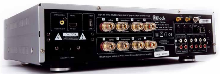
Sogar zwei Paar Vorverstärkerausgänge sind vorhanden

Bereits beim Auspacken der Sonderedition erahnt man, dass es sich um ein exklusives Produkt handelt. Denn sicher in Schaumstoff verpackt liegt neben dem Gerät eine Holzkiste, in der sich als kleine Überraschung ein edler Rotwein aus Italien verbirgt. Wein- und Musikgenuss harmonieren ja auch bestens.